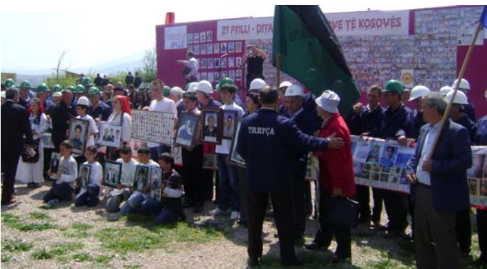
27 April 2009: Meja Kosovo; 10th Annual Ceremony of the Missing Persons in Meja

25 Prill në Godinën e Qeverisë së Kosovës përfaqësuesi i IFFAMPAC –ut mori pjesë në tryezën e rumbullakët për të gjetur zgjidhje në zbardhjen e fatit të të zhdukurve