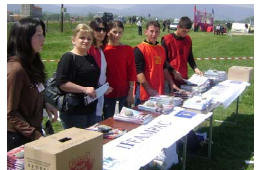
IFFAMPAC with volunteers distributed pamphlets and commemorative journal to those attending Meja ceremony.