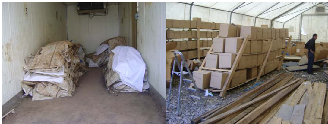
Pamje ku ruhen artefaktet e personave të zhdukur

IFFAMPAC-dega në Prishtinë ka ofruar idetë e veta për zgjidhjen e kësaj çështje të dhembshme dhe madhore.